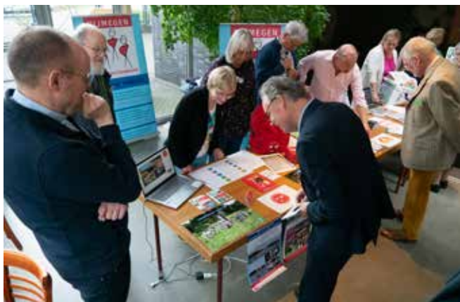
Stand van de vakantiebank bij de uitreiking van de waarderingsprijs

Vakantiebank Delft is heel blij met alle betrokkenheid en dankt allen voor hun gulle giften.