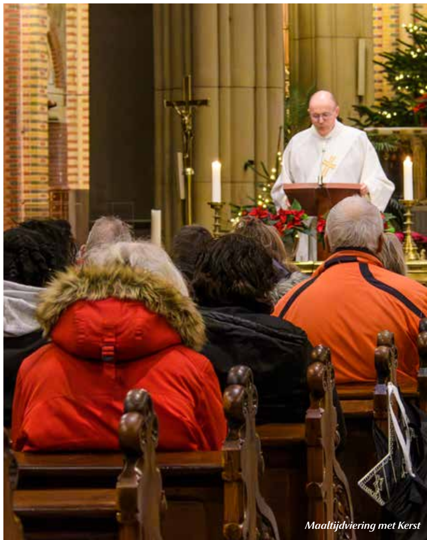
Maaltijdviering met Kerst