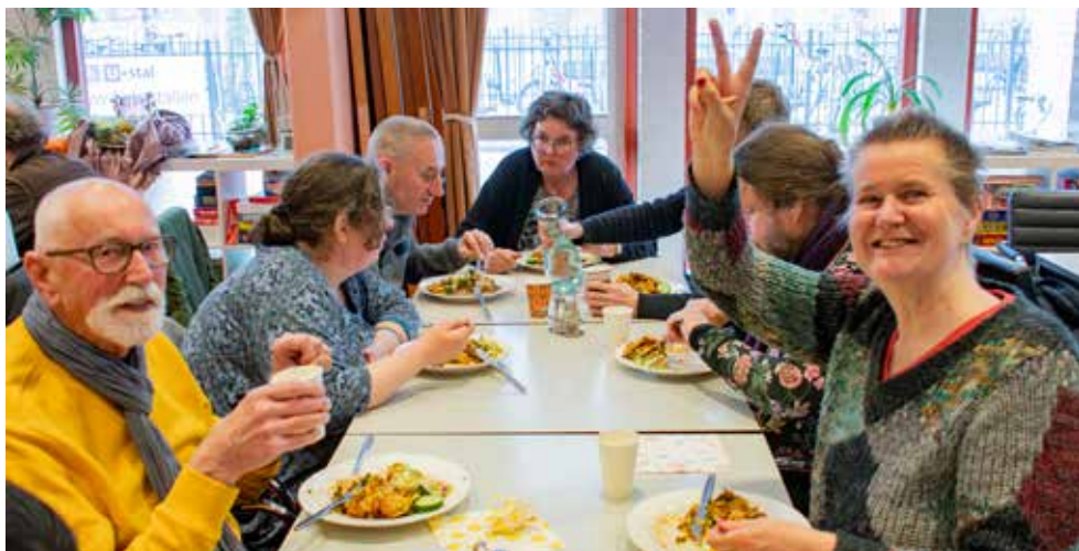
Gezamenlijke Paas-maaltijdviering in de Jessehof