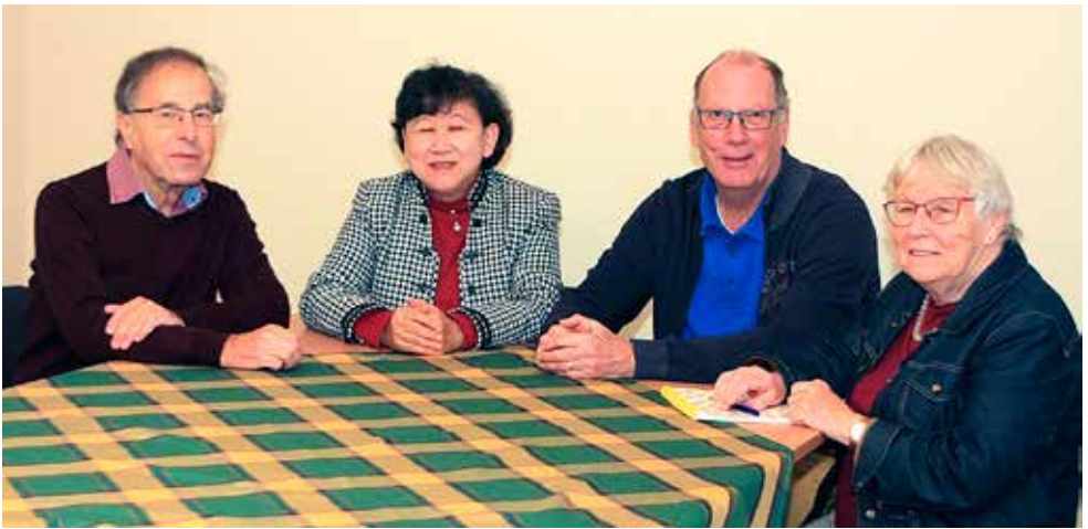
Het vrijwilligersteam van Non-foodbank Delft