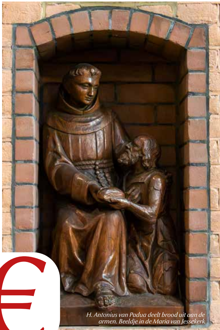
H. Antonius van Padua deelt brood uit aan de armen. Beeldje in de Maria van Jessekerk