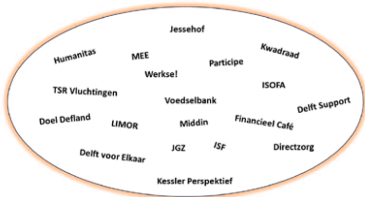
Figuur 2.1: Samenwerkingsverbanden Non-foodbank Delft

Non-foodbank Delft werkt nauw samen met tal van maatschappelijke organisaties. In figuur 2.1 is hiervan een overzicht weergegeven.